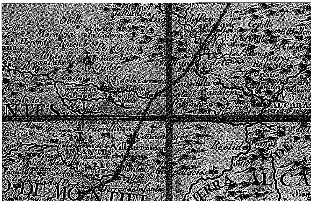
Figura 1: El camino Real de Granada a Cuenca en la Cartografía de Thomas López (1765). Elaboración gráfica, Ángel Plaza.

que se mantendrá en siguientes obras (Valladares, 2001). Esta unificación tiene un precedente en una guía francesa de 1662 llamada Le voyage de France, dressé pour la commodité des françois & estrangers, donde se describe una ruta [...] de Burgos à Cuenca et de là á Grenade [...] (Du Vernier y Varennes, 1662: pp. 587-589). En dicho trazado se puede identificar claramente el camino renacentista, con sus mismas estaciones, aún cuando cambia algo la grafía y se establece algún lugar de paso intermedio no tenido en cuenta antes. Como colofón, obras cartográficas algo más tardías en las que aparecen consignados los caminos, especialmente la de Thomas López en el siglo XVIII (López de Vargas, 1765 y 1766), permiten ofrecer un esbozo unitario y global del itinerario renacentista, aunque con breve referencia a las localidades por las que discurre. En la figura 1, se resalta el trayecto del camino sobre el mapa de 1765 obra del Pensionista de Su Majestad.